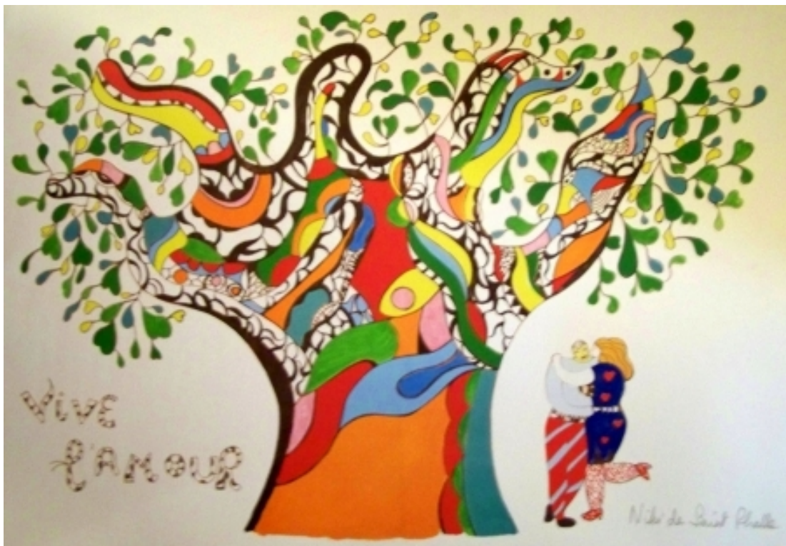
Niki de Saint Phalle