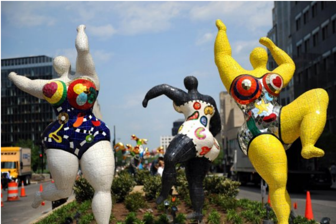
Nikki de Saint Phalle